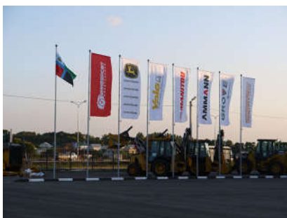
Флагштоки уличные алюминиевые - Белгород УниверсалСпецТехника