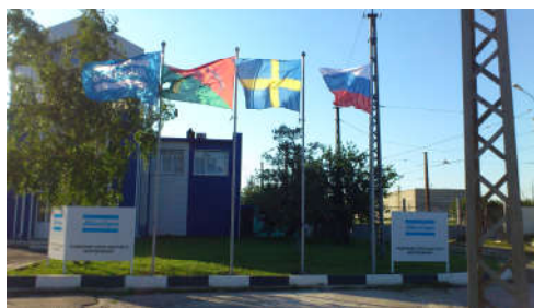
Флагштоки уличные алюминиевые - Старый Оскол Атлас Копко